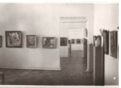
Sala kubizmu, II piętro galerii, 1948-1950