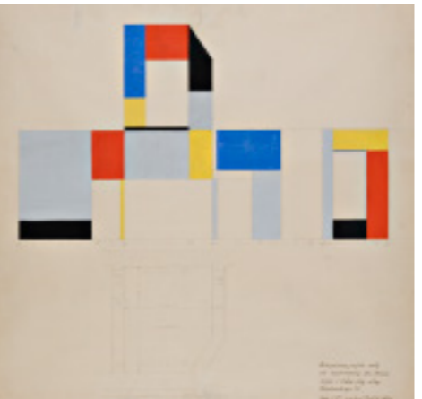
gouache, cardboard, 99 x 78.3 cm