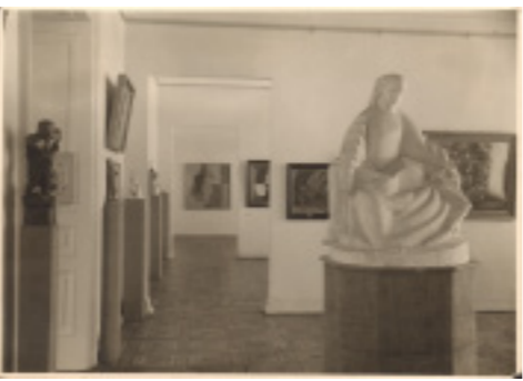
Sala formizmu, II piętro galerii, 1948-1950