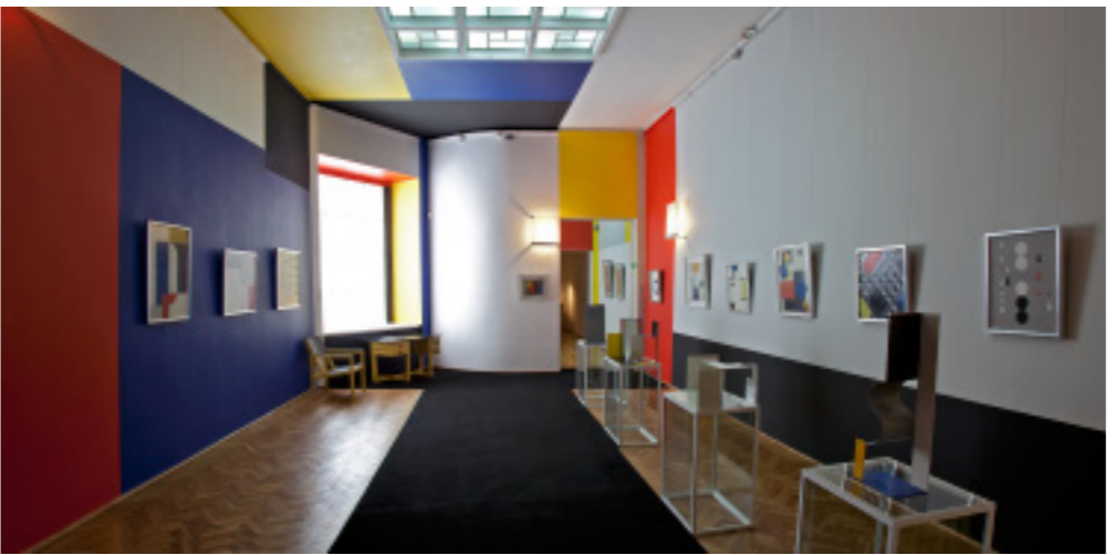
Sala Neoplastyczna, 2010